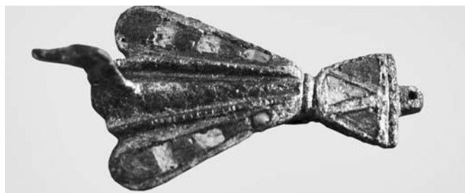
4. kép. Emailos díszű, ezüstözött bronz madár alakú fibula a 2002. évi ásatás anyagából

A fibulák között leggyakrabban a térdfibulák különféle változatai fordulnak elő, az erős profilú egycsombos fibula mindössze egyetlen példányban lelhető fel. Az emailos díszű (tűzománc jellegű díszítés) darabok közül kettőt emelhetünk ki, az egyik egy ezüstözött madár alakú bronzfibula, szárnyát váltakozva fehér és zöld emailmezők díszítik (4. kép). Ritkább darabnak számít a másik változat, melynek egy-egy darabja szinte valamennyi provinciából ismert. Elülső feje kutyát, a hátsó kigyót ábrázol, s így a figura a mitológiai teremtmények