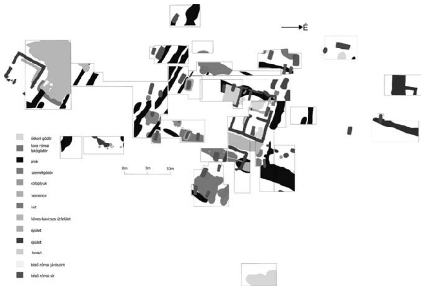
3. kép. Almásfüzitő – vicus, 1998–2003. évi ásítások helyszínrajza

során megfigyelt falakat négy különböző épülethez kötjük, melyek a kőperióduson belül is két külön fázishoz tartoznak. Az 1/a épület az omladékából ítélve kőalapozású vályogfalú építmény lehetett, az alapozás megmaradt vastagsága mindössze 50 cm, falát fehér-vörös festésű falfestménnyel díszítették. Ez az épület a kőperióduson belül a legkorábbi időszakot jeleníti meg. A 3. sz. épületnél hasonló jelenséget figyelhetünk meg: az előző épületekhez hasonlóan az utolsó két kősr került elő, falának vonalát a részben meszes kavicsos feltöltött falárok bontásával lehetett nyomon követni, szélessége 60–70 cm. Egy legalább négy helyiséges épületről van szó, melynek DNy-i részében egy 3 x 3,5 méteres freskóval díszített helyiséget is feltártunk; a darabok többségén növényi ornamentikát figyeltünk meg. A korábbi, 2. sz. épület falát csak nyomokban lehet regisztrálni, falvastagsága az 1/a épülethez hasonlóan 50 cm. A 3–4. számú épületek egykorúak, köztük egy keskeny köves-kavicsos-teglás szerkezetű út húzódik, amely mindössze 2,20–2,40 méter széles. Az utóbbi, 4. sz. épület az egyetlen, ahol nem csupán az alapozást (vastagsága 80 cm), hanem a felmenő falakat is megtaláltuk, ezek vastagsága 60 cm.