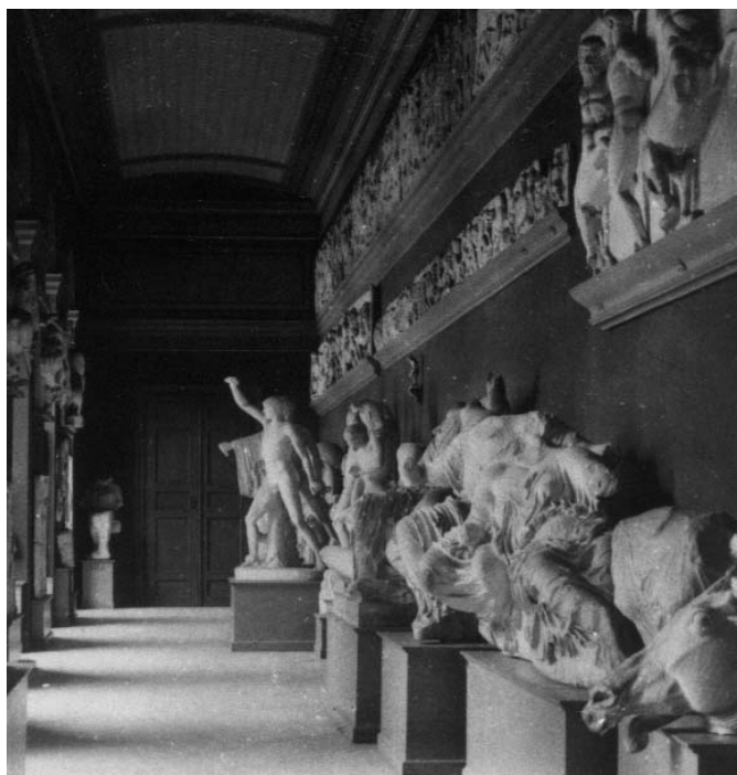
Görög szobrok gipszöntvényeinek állandó kiállítása a Magyar Nemzeti Múzeumban. Keleti folyosó. Előtérben a Parthenon oromzati szobrai, háttérben a Zarnokölök. (Fővárosi Szabó Ervin Könyvtár, Budapest-gyűjtemény; a gyűjtemény reprodukciója)

A teljes kiállítás mintegy 250 másolatból állt. Martinelli kollekciójának hála, a darabok nagyjából fele „valódi görög” mű volt, a Parthenon az Erechtheion, az Athéna Niké-templom, a Théseion (azaz Héphaisteion) és a Szelek tornya architektonikus részleteinek és szobrászati díszítésének másolatai mellett számos domborműves sírsztélé és votív szobor, például a Thérai Apollón, a Borjúvivő vagy az eleusisi Triptolemosztábla öntvényei. Martinellitől származott két olyan darab is – az első Parthenon egyik Gorgó-fejes akrotérionja és Aristión sírsztéléje –, amelyekről két öntvény érkezett, egyikük az eredetint látható színmaradványok alapján festett rekonstrukcióval. A görög nagyszobrászat egykori színességének érzékeltetése Budapesten mindvégig e két darab kiállítására