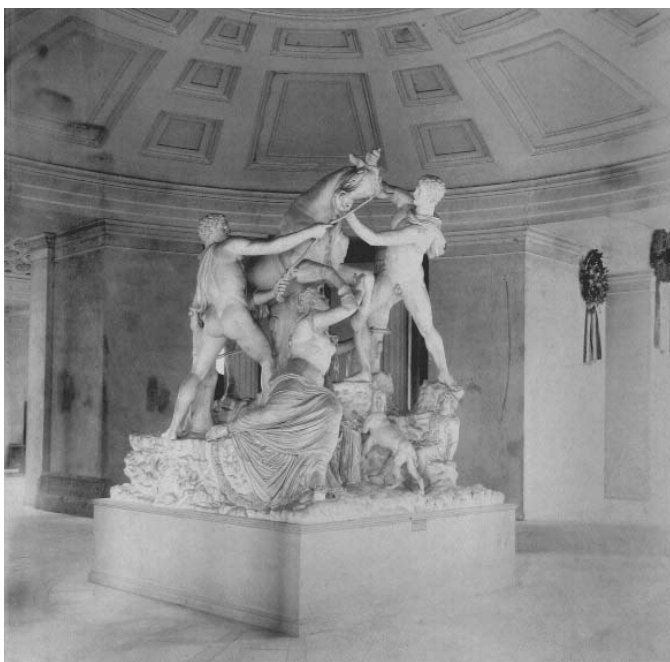
A Magyar Nemzeti Múzeum magasföldszinti kerek terme a Farnese-bika másolatával

A VIII. terem (és a folyosó) volt a Nemzeti Múzeum első olyan helyisége, amelyet a benne kiállított tárgyakhoz „illőnek” talált módon készítettek. A következő években, majd évtizedeken át felerősödtek azok a hangok, hogy az osztály minden termét ezen a módon kellene a kiállításához igazítani, de az elképzelés soha nem valósult meg. A görög gipszmásolat-gyűjtemény installálásán kívül csupán a múzeum díszlépcsőháza kapott ebben a korszakban a kortársak által a nemzet múzeumához méltónak érzett kialakítást 1880-ra Than Mór (1828–1899) és Lotz Károly (1833–1904) Magyarország művelődéstörténetének fénypontjait ábrázoló képciklusával, Schickedanz Albert (1846–1915) színes üveglakkaival, illetve az oldalfalak építészeti tagolásának gipsztagozatokkal történt gazdagításával és műmárványozásával – ezt a teret azonban nem elsősorban a múzeum használta. Pollack Mihály (1773–1855) „nemesen egyszerű” klasszicista architektúráját akkoriban külső és belső megjelenésében is rendkívül szegényesnek